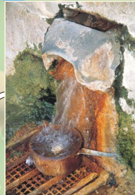
La source du Par à 82°C, Chaudes-Aigues