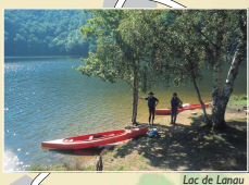
Lac de Lanau